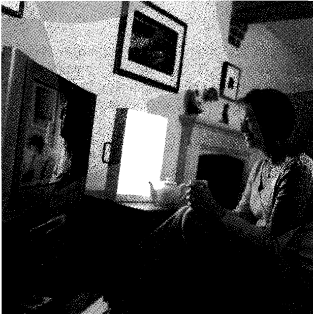
Los medios masivos concentraban la difusión de sus mensajes en la población urbana pudiente

en los casos de la prensa escrita y la televisión. El contenido de dichos mensajes, del todo ajeno al campesinado, prefería lo trivial y lo sensacional a lo sustantivo y a lo útil para procurar el desarrollo nacional. Más aun, en diversas formas los medios contribuían al mantenimiento del status quo propicio a la perpetuación de la dominación oligárquica en desmedro de las mayorías oprimidas. La propiedad de aquellos era mayoritariamente privada y mercantil, y en algunos casos monopólica.